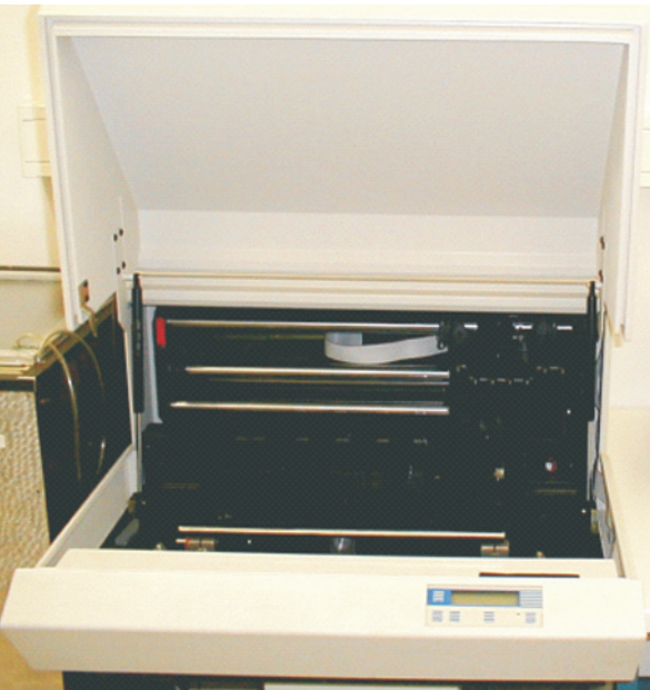
Leiterbildzeichenmaschine EMMA 210